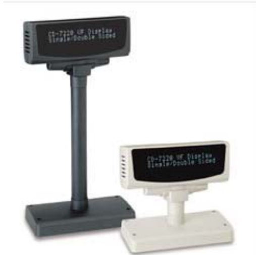
Lector óptico (Pistola)

Sin temor al infinito Calle 67 No. 6-60 Penthouse, Bogota – Colombia Tel (57-1)2495500 enarriendo@capigono.com.co